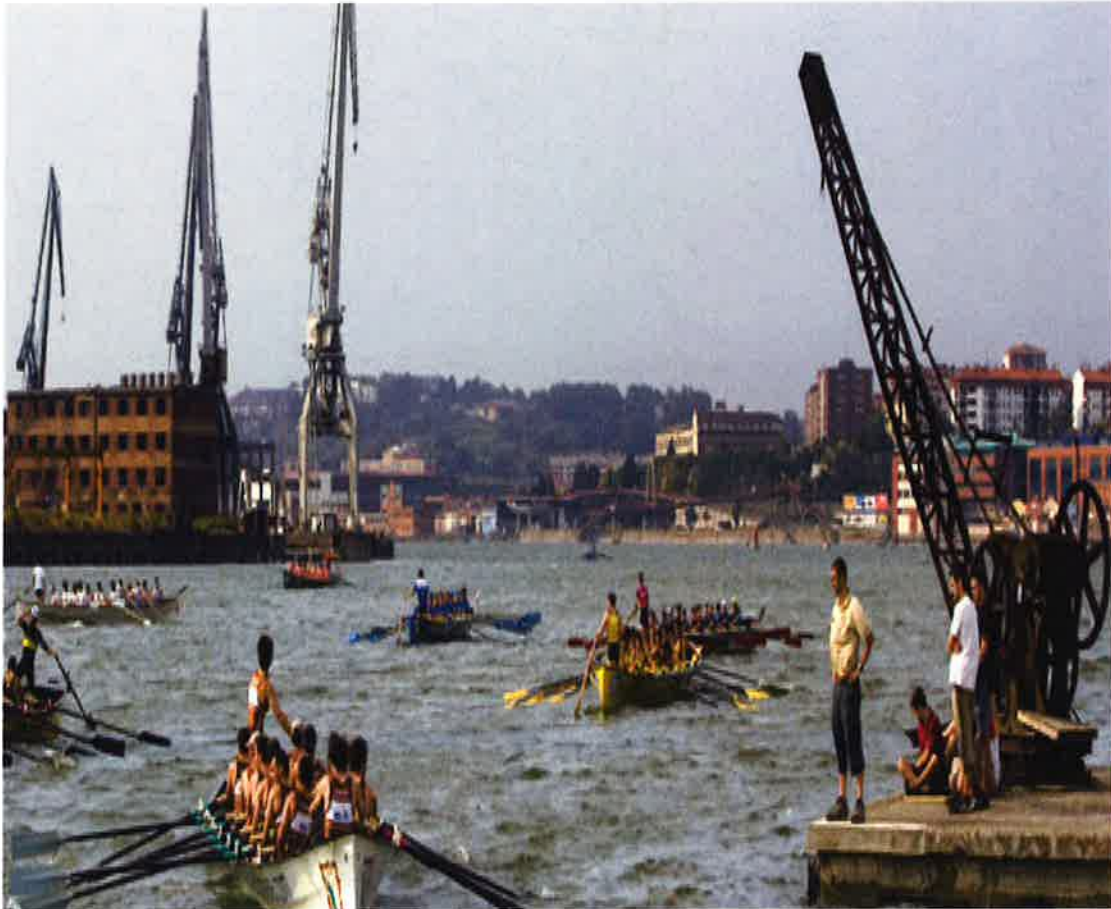
XXVII Bandera de Erandio

La aportación de 9.900 euros a este municipio se destina a subvencionar la “XXVII Bandera de Erandio”, regata de traineras que se celebró el 30 de agosto de 2014 en colaboración con “Lutxana Arraun Elkarte”.